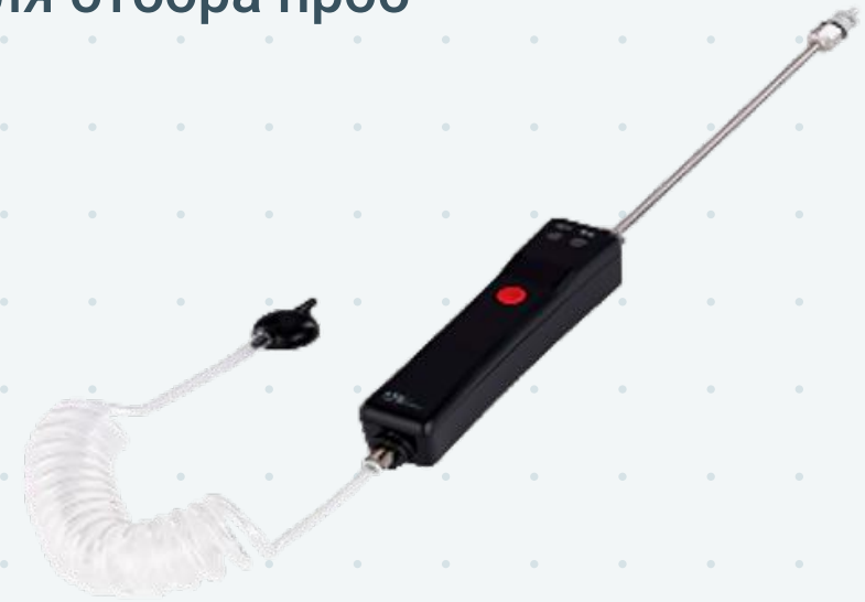
Моторизированный насос для отбора проб